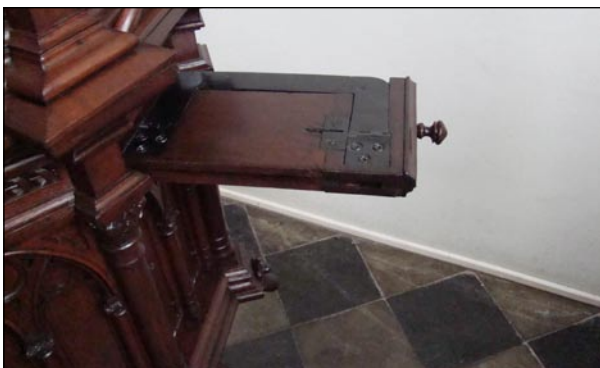
Chrzcielnica - wysuwana półeczka na Biblię