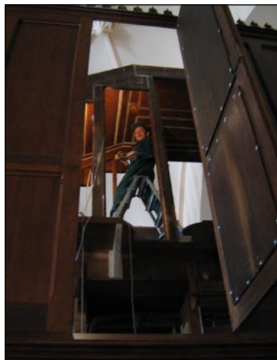
Prace przy skorowaniu szafy ekspresyjnej