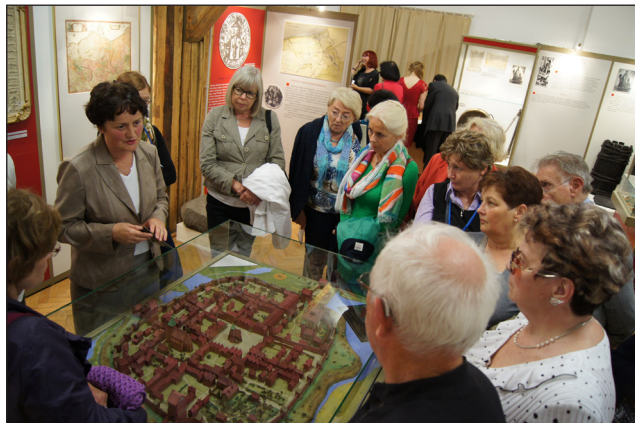
Uczestnicy Forum odwiedzili Muzeum Państwowe w Koszalinie.

W dniach 12-15 września 2013 r. w Centrum Luterzańskim w Koszalinie odbyło się XIX Forum Ewangelickie o temacie przewodnim: „Przyszłość Kościoła – Kościół przyszłości”. Jego uczestnicy dyskutowali o roli kobiet, mężczyzn, duchownych, świeckich i mediów w Kościele przyszłości.